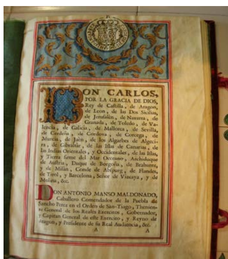
Primera página del memorial de los López de Sabiñánigo