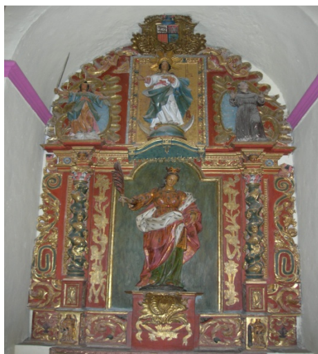
Retablo de Santa Orosia