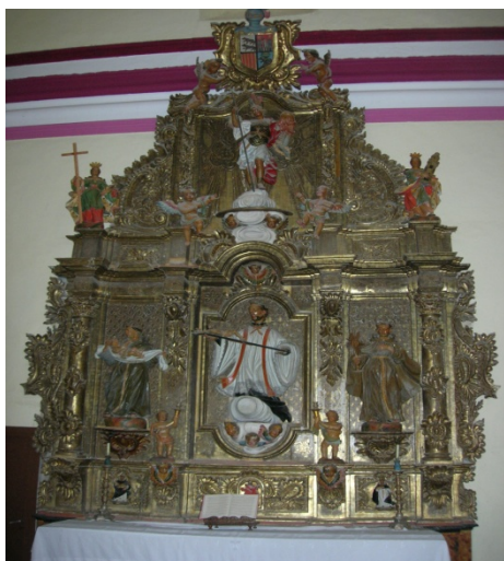
Retablo de San Francisco Javier